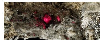
Jakob Kudsk Steensen (*1987) The Ephemeral Lake , 2024 Live-Simulation (Still) Commissioned by Hamburger Kunsthalle © Courtesy the artist

Diese Pressebilder stehen in druckfähiger Qualität im Online-Presseservice unter www.hamburger-kunsthalle.de zum Download bereit. © Veröffentlichung nur gestattet im Zusammenhang mit einer aktuellen redaktionellen Berichterstattung über die Ausstellung in der Hamburger Kunsthalle. Jede andere Nutzung ist nicht gestattet. Die Bilder dürfen nicht angeschnitten und/oder mit Schrift überschrieben werden. Publication only allowed in connection with editorial reports of the exhibition. Any other use is not allowed. The photos should not be cropped or overwritten with any form of text.