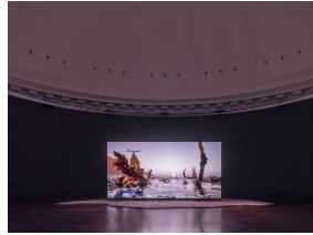
Installationsansicht der Ausstellung The Ephemeral Lake – Eine digitale Installation von Jakob Kudsk Steensen , 12. April bis 27. Oktober 2024, Hamburger Kunsthalle