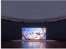
Installationsansicht der Ausstellung The Ephemeral Lake – Eine digitale Installation von Jakob Kudsk Steensen , 12. April bis 27. Oktober 2024, Hamburger Kunsthalle