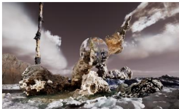
Jakob Kudsk Steensen (*1987) The Ephemeral Lake , 2024 Live-Simulation (Still) Commissioned by Hamburger Kunsthalle