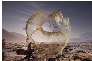
Jakob Kudsk Steensen (*1987) The Ephemeral Lake , 2024 Live-Simulation (Still) Commissioned by Hamburger Kunsthalle