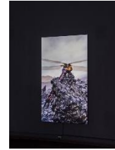
Installationsansicht der Ausstellung The Ephemeral Lake – Eine digitale Installation von Jakob Kudsk Steensen , 12. April bis 27. Oktober 2024, Hamburger Kunsthalle © Courtesy the artist © Hamburger Kunsthalle, Foto: Christoph Irrgang