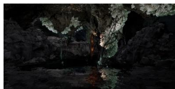
Jakob Kudsk Steensen (*1987) The Ephemeral Lake , 2024 Live-Simulation (Still) Commissioned by Hamburger Kunsthalle