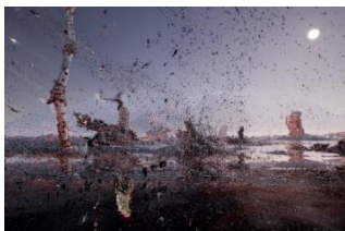
Jakob Kudsk Steensen (*1987) The Ephemeral Lake , 2024 Live-Simulation (Still) Commissioned by Hamburger Kunsthalle