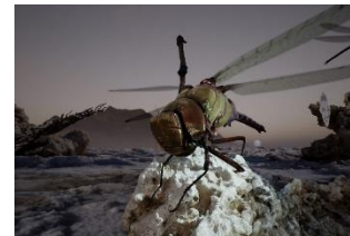
Jakob Kudsk Steensen (*1987) The Ephemeral Lake , 2024 Live-Simulation (Still) Commissioned by Hamburger Kunsthalle