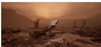
Jakob Kudsk Steensen (*1987) The Ephemeral Lake , 2024 Live-Simulation (Still) Commissioned by Hamburger Kunsthalle