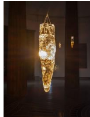
Installationsansicht der Ausstellung The Ephemeral Lake – Eine digitale Installation von Jakob Kudsk Steensen , 12. April bis 27. Oktober 2024, Hamburger Kunsthalle © Courtesy the artist © Hamburger Kunsthalle, Foto: Christoph Irrgang