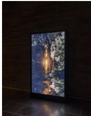
Installationsansicht der Ausstellung The Ephemeral Lake – Eine digitale Installation von Jakob Kudsk Steensen , 12. April bis 27. Oktober 2024, Hamburger Kunsthalle